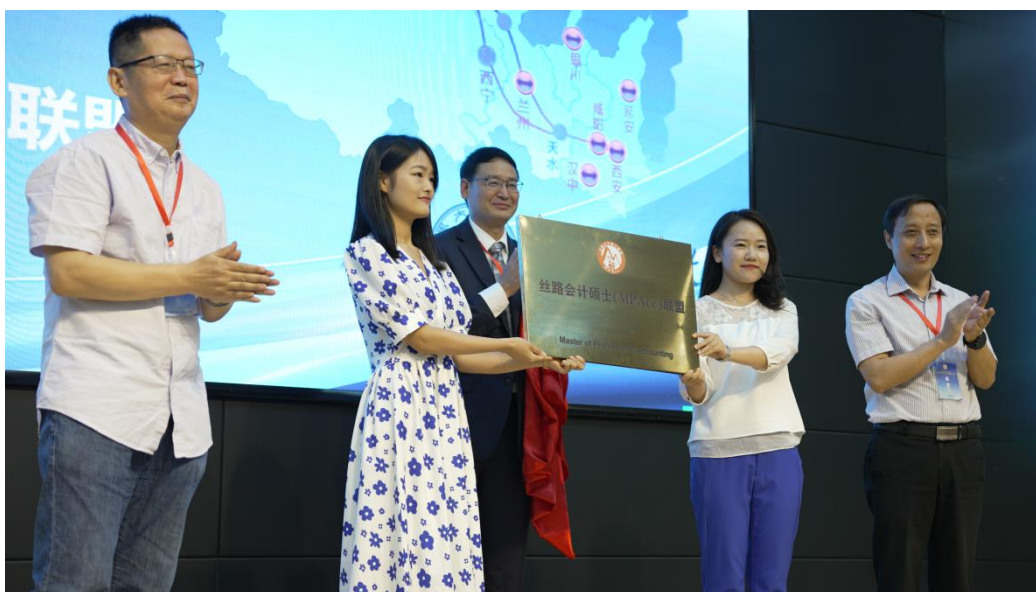
“丝路会计硕士（MPAcc）联盟”揭牌仪式