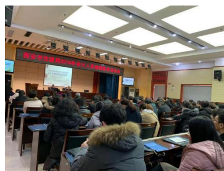
西安市住房和城乡建设局

通过培训，不仅让会计人员及时了解到最新的会计相关制度、法规，更新了会计技能，也进一步提高了会计人员业务素质和专业胜任能力。