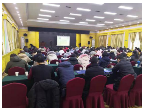
西安城市基础设施建设投资集团有限公司

企业类培训的主要科目是《企业会计准则第7号—非货币性资产交换》、《最新增值税政策》；行政事业单位培训的主要科目是《政府会计准则第7、8、9 会计调整、负债、财务报表编制和列报》、《管理会计应用指引第803号—行政事业单位》、《最新个人所得税政策》。此次授课极具针对性和实用性，受到了全体学员的一致好评。培训后，进行了继续教育测试。